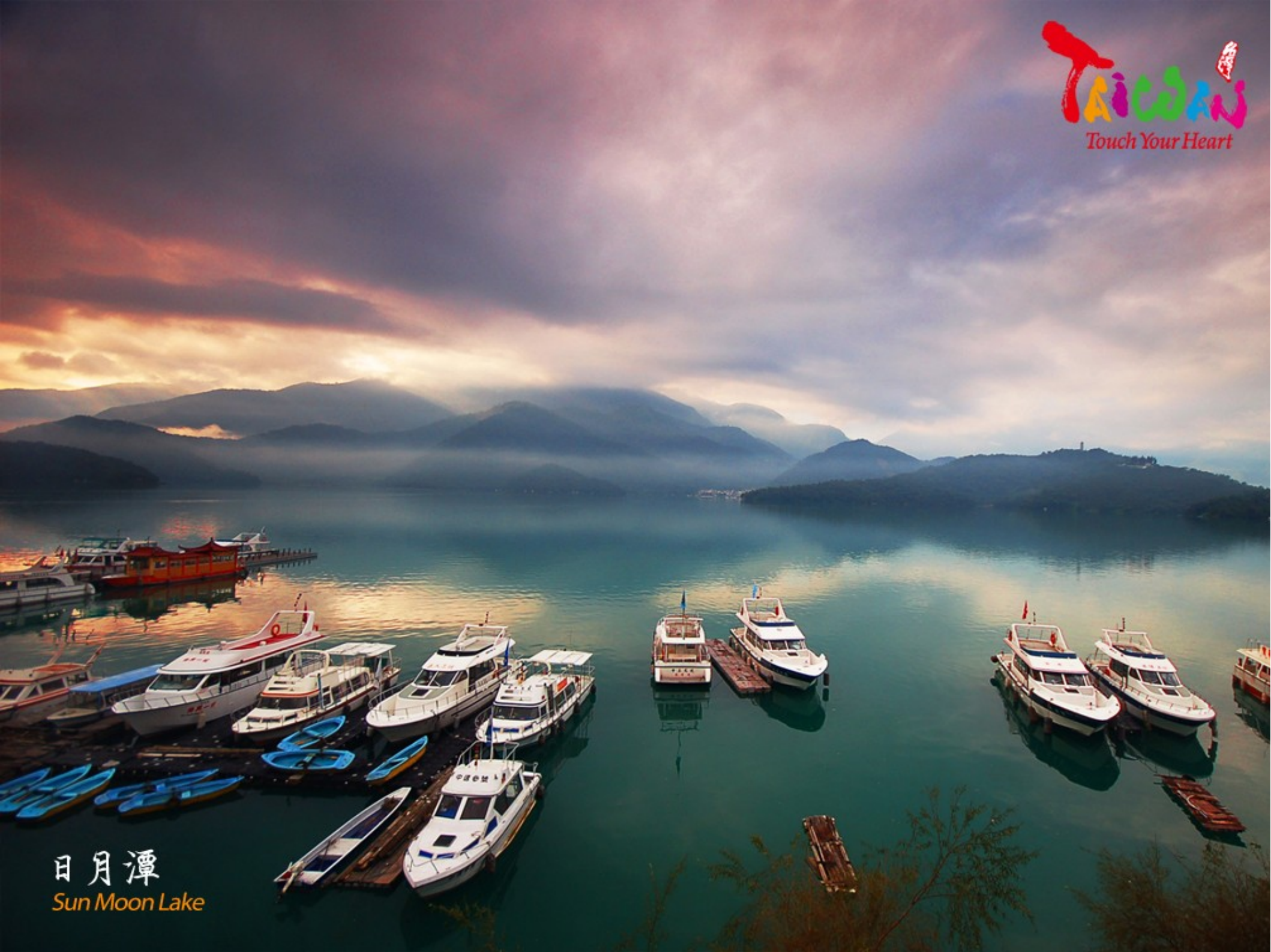
日月潭 Sun Moon Lake